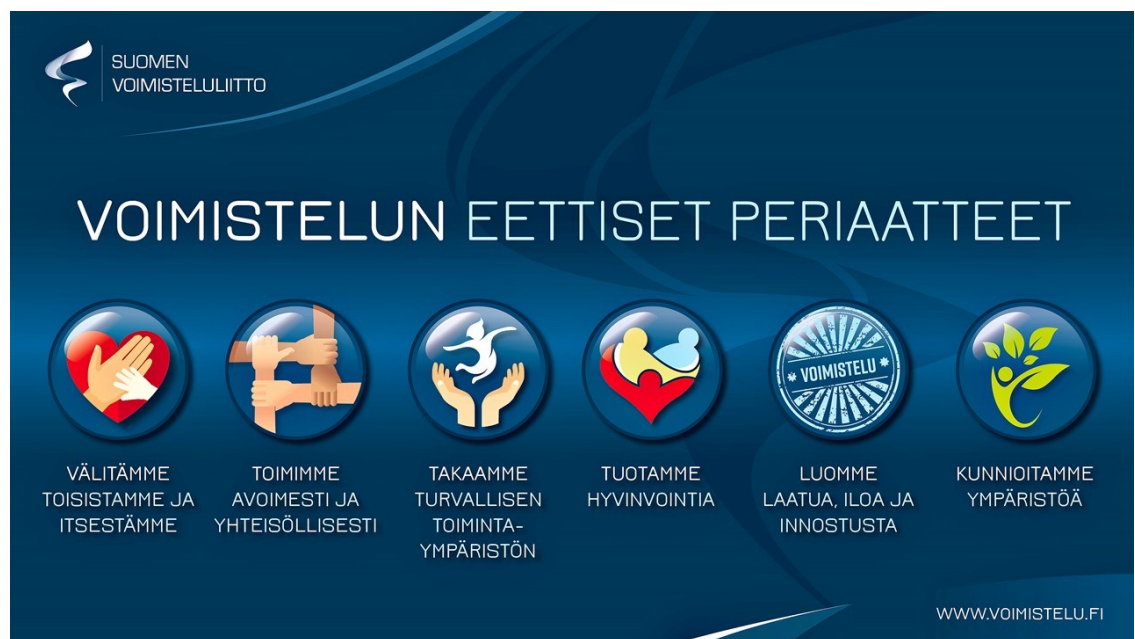
Kuva 2. Voimistelun eettiset periaatteet (Suomen Voimisteluliitto).

Heinolan Voimisteluseuran hallitus on sitoutunut Olympiakomitean Reilun pelin periaatteisiin 5 sekä Voimisteluliiton eettisiin periaatteisiin (kuva 2). Jokainen hallituksen jäsen on suorittanut Olympiakomitean Seuran hallinto -verkkokurssin 6 .